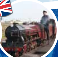
"Le Romney, Hythe & Dymchurch Railway"