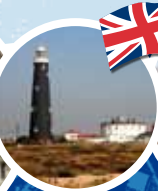
Plage de Dungeness