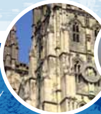
Cathédrale de Canterbury