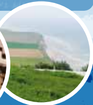
Cap Blanc Nez