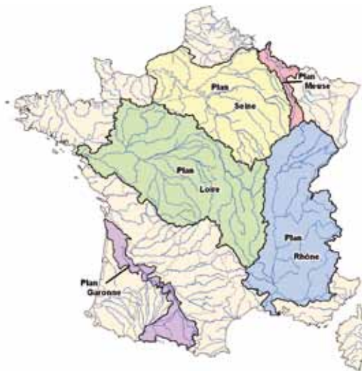
Les plans grands fleuves

pouvant faciliter la réalisation de projets de PAPI. On veillera donc à ce que l'organisation de la gouvernance des projets de PAPI émergents sur le territoire couvert par un plan grand fleuve soit cohérente, voire intégrée, avec celui-ci. Tout nouveau projet de prévention des inondations reste cependant soumis au processus de labellisation PAPI, sauf s'il a déjà fait l'objet d'une contractualisation.