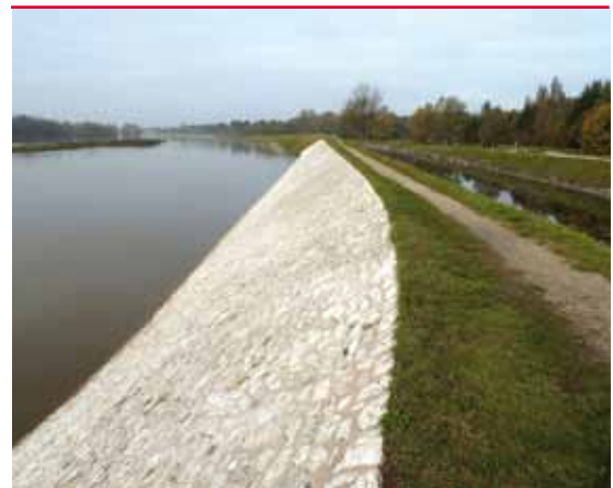
Digue sur la Loire en crue

tique toute augmentation du niveau de protection d'un système d'endiguement devra s'inscrire, pour être éligible à l'aide de l'État, dans le cadre d'un projet global de prévention des inondations labellisé PAPI.